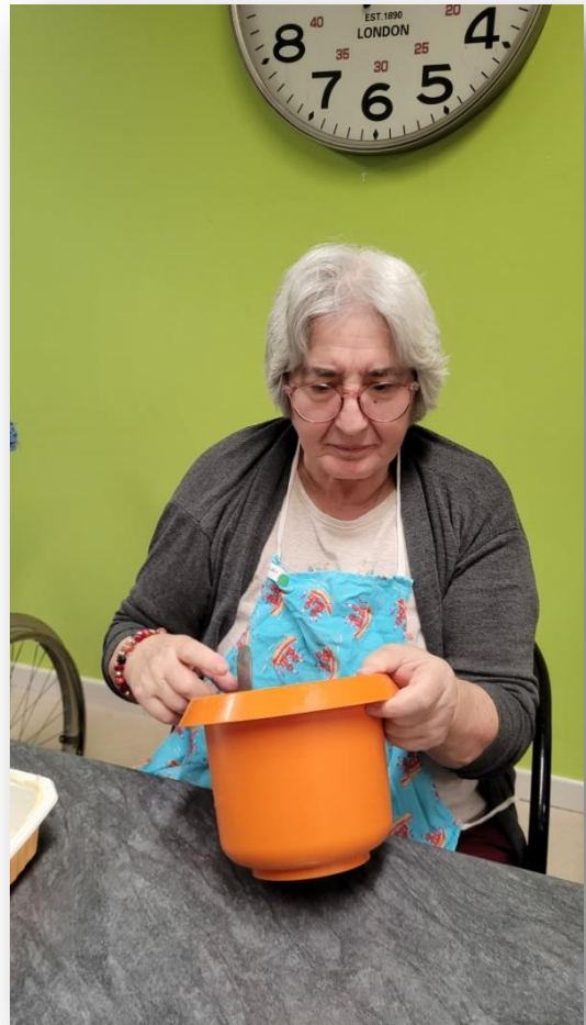
Bavardages, rires, fou rires, chants et concentration