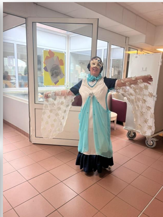
Notre reine des neiges