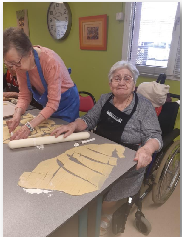
Chacun fait selon ses possibilités, assis ou debout, étend, découpe ou observe.